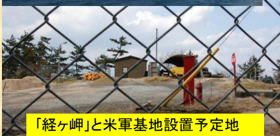
「経ヶ岬」と米軍基地設置予定地 (京丹後市丹後町)