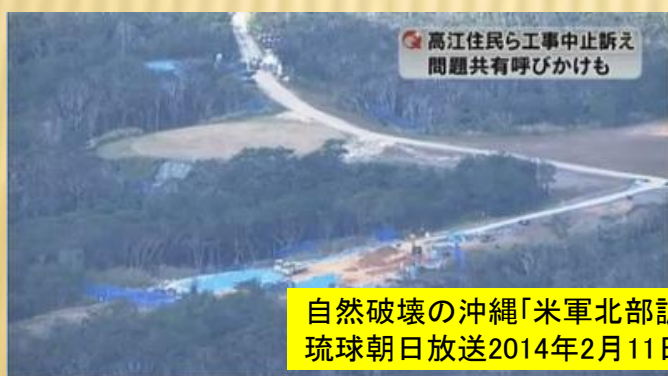
自然破壊の沖縄「米軍北部訓練場」 琉球朝日放送2014年2月11日

「ヘリパッドいらない」住民の会 1962年 美里村(元沖縄市)に生まれる 1991年 仕事の関係で高江に移り住む。 2007年 北部訓練場のヘリパッド建設に反対し座り込みをはじめ。 2008年 沖縄防衛局は住民15名を地裁に通行妨害禁止仮処分を求める。 2010年 住民2名に対し仮処分を認める。 2012年 那覇地裁は1名に国の請求を棄却1名に妨害を認める判決。控訴。係争中。