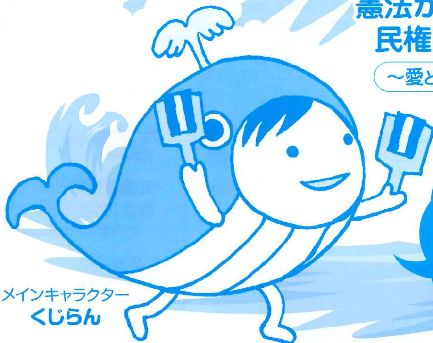
メインキャラクター くじらん