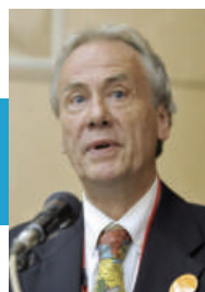
ライナー ・ブラウン