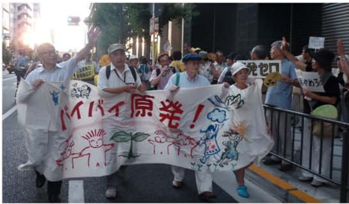
(関電京都支店前で「大飯原発すぐ停止を」とデモする市民8/31)

今夏、関西電力は445万kW（15%）も電力が不足するとして、計画停電まで持ち出して再稼働を強行しました。しかし、実際の需要のピークとなった8月3日は、2682万kWで、この日の供給は原発を除いても2763万kWと、81万kWの余裕がありました。関電の想定は「需要は過大、供給は過小」と批判されていますが、事実で証明されました。